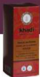
HENNÉ PUR ROUGE